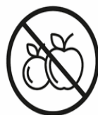
OBST | GEMÜSE FRUIT | VEGETABLES