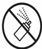
SPRAYDOSEN AEROSOL SPRAYS