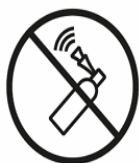
DRUCKLUFTFANFAREN | VUVUZELAS MECHANICAL AND ELECTRICAL NOISE-MAKING DEVICES