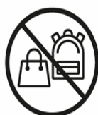
RUCKSÄCKE | TASCHEN GRÖßER ALS DIN A4 BAGS BIGGER THAN DIN A4