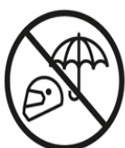
REGENSCHIRME MIT METALLSPITZE | HELME UMBRELLAS WITH METAL SPIKES | HELMETS