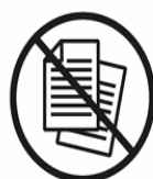
FLUGBLÄTTER | BROSCHÜREN LEAFLETS | BROCHURES