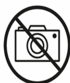
PROFIKAMERAS | KAMERASTATIVE PROFESSIONAL CAMERAS | CAMERA TRIPODS