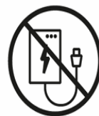
POWERBANKS ÜBER | OVER 100G