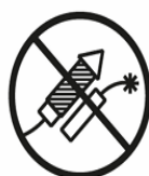
PYROTECHNISCHE GEGENSTÄNDE PYROTECHNIC DEVICES