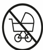
KINDERWÄGEN | ROLLATOREN PRAMS | WALKING AIDS