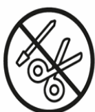
SCHEREN | FEILEN SCISSORS | FILES