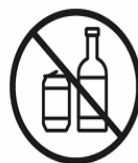
GLASFLASCHEN | DOSEN | PLASTIKFLASCHEN | TETRA PAK GLASS BOTTLES | CANS AND PLASTIC BOTTLES | TETRA-PAK CARTONS