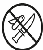
MESSER | WAFEN KNIVES | WEAPONS