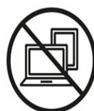
LAPTOPS | TABLETS LAPTOPS | TABLETS