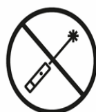
LASERPOINTER LASER POINTERS