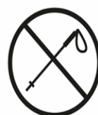
TELESKOP-/WALKINGSTOCK TELESCOPIC/WALKING STICK